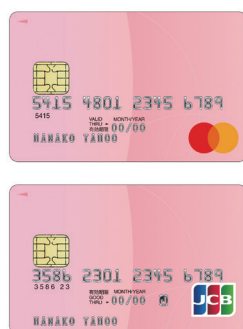
KC カード(シャンパンピンク)